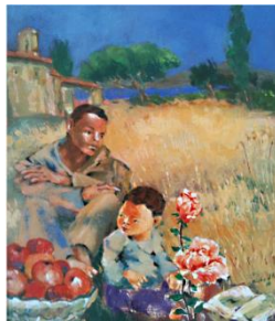
Peintures de Richard HOLTERBACH