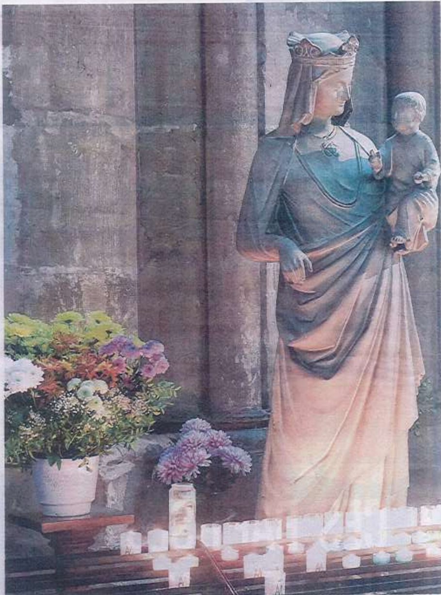
Pour faire annuler un baptême, il faut écrire au diocèse où a eu lieu le sacrement.

« Vers 2005, on enregistrait en moyenne une quinzaine de demandes. En 2018, ce chiffre a doublé et depuis janvier, onze requêtes ont été reçues », observe le directeur de la communication du diocèse de Soissons. La cause reste difficile à