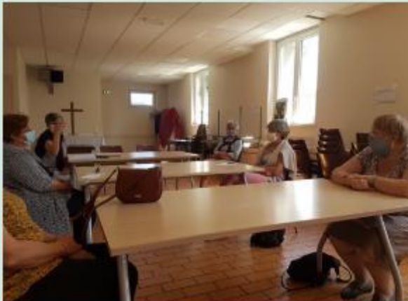
Temps de partages

Si le retour à la normale n'est pas pour demain, cette réunion nous a montré le chemin à suivre . Car même s'il paraît parfois bien tortueux, le chemin de la reprise n'est en rien une impasse et il doit nous permettre de réinventer la révolution fraternelle .