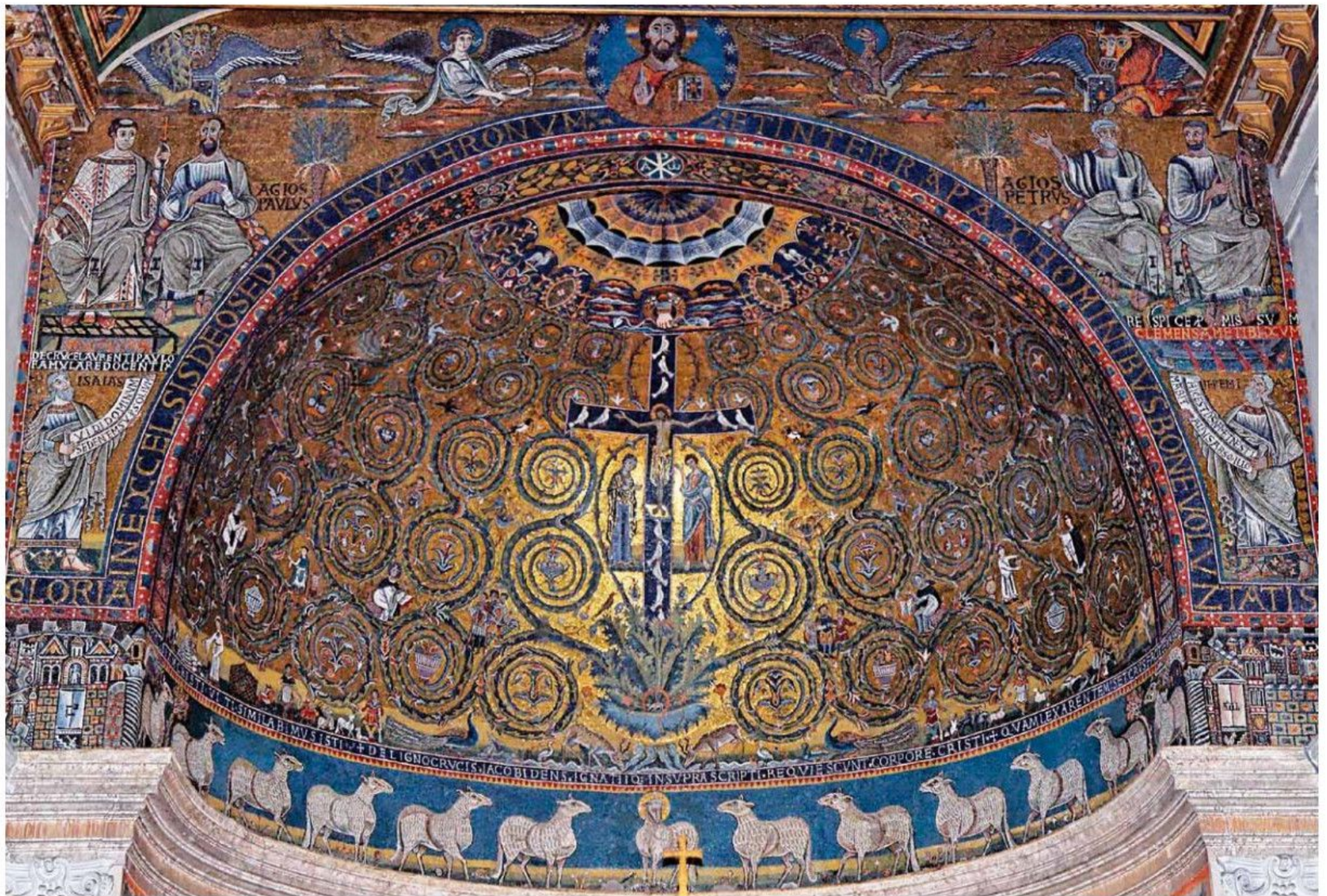
Mosaïque de la basilique saint Clément à Rome.