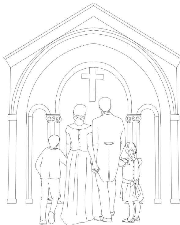
Dessin à colorier avec les plus petits

qu'elle grandisse dans l'unité et dans la paix.