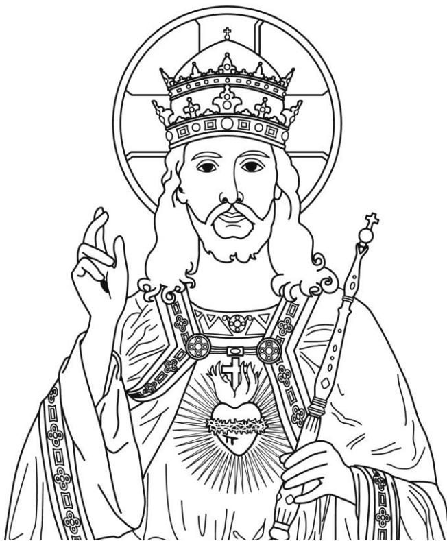
Jésus-Christ, Roi de l'Univers

Par la croix du vrai pasteur, Alléluia, où l'enfer est désarmé, Par le corps de Jésus Christ, Alléluia, qui appelle avec nos voix, Sur l'Église de ce temps, Alléluia, que l'Esprit vient purifier.