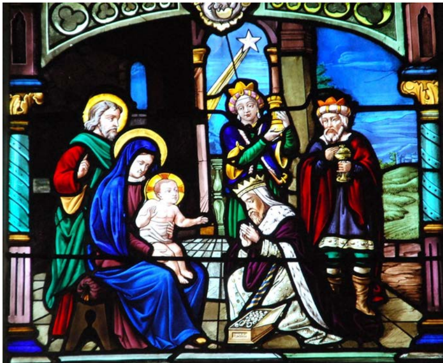
Eglise de Charly-sur-Marne

«Dieu vous a appelés dans votre nuit pour que vous entriez dans sa lumière :