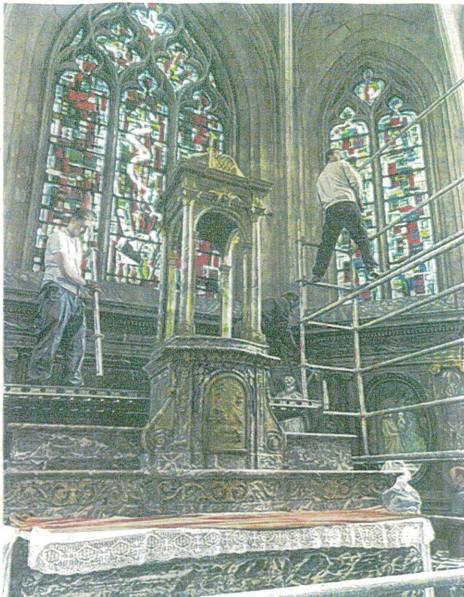
L'installation, début décembre, de cet « élément architectural » a été assez spectaculaire.

statue de Notre-Dame de Liesse comble actuellement son intérieur. « Ce dais date probablement du XIX e siècle et a sûrement été retiré dans les années 60 pour des raisons que nous ignorons », explique le curé des deux paroisses du sud de l'Aisne qui profite des savoir-faire de tous les paroissiens qui l'entourent pour non seulement restaurer le dais mais aussi améliorer l'aménagement de ses abords. « Quand on est arrivés, les chandeliers avaient été démantelés et étaient à terre », raconte-t-il, précisant qu'un membre de la paroisse