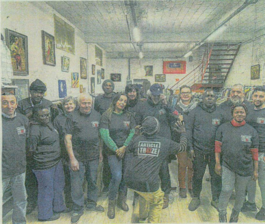
Sur le tee-shirt des compagnons de Rozières-sur-Crise, l'article 13 de la Déclaration universelle des Droits de l'Homme M.G.

Le vêtement noir est simple, mais les inscriptions dessus sont percutantes. Visibles en lettres blanches, deux alinéas sont repris de l'article