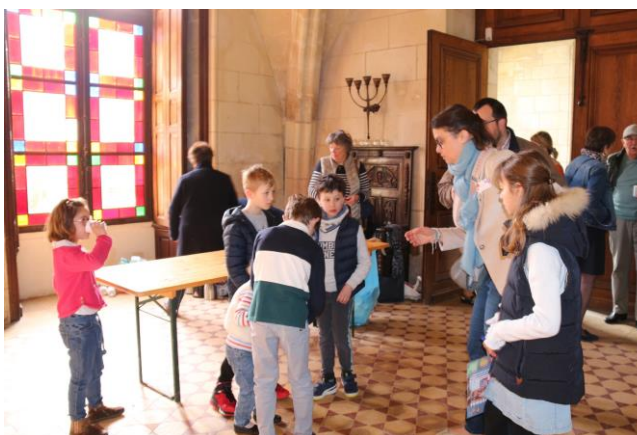
L'assemblée commence !