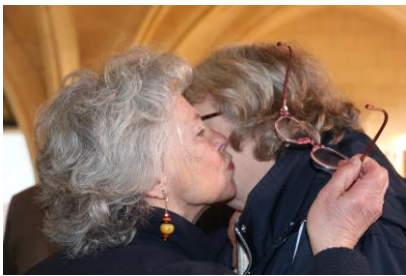
Que c'est bon de se retrouver ....